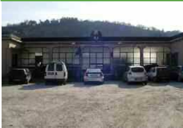
L'ingresso del Poligono di Benevento