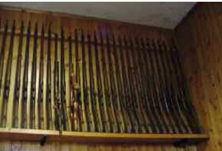
Collezione di moschetti del poligono

la copertura. Nel 1985 sono iniziati i lavori per la costruzione di un poligono a 25 m a fuoco con impianto chiuso a cielo aperto. Nel 1990, grazie all'intervento della UITS, che ha concesso un importante contributo alla sezione e al lavoro volontario dei soci del TSN, sono iniziati i lavori di costruzione di un poligono a 10 m. Tra il 1990 e il 1994, infine, è stato realizzato anche l'impianto di BM, grazie ai contributi dell'Unione e del CONI.